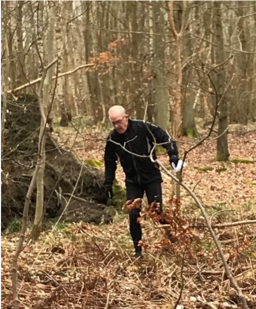
Tekst og foto af Peter Sørensen

F.. h..... d. en træls sæson med næsten ingen orienteringsløbskonkurrencer. Ja af politiløb vi fik alene afviklet første etape af Københavner Cup den 18. august, ellers har alt været nedlukket på grund af Corona, yderst deprimerende. Man bliver helt trist i sindet, hvis man tager et kikk på aktivitetslisten på Politi Idræts hjemmeside. AFLYST, AFLYST, AFLYST, UDSAT, UDSAT UDSAT..