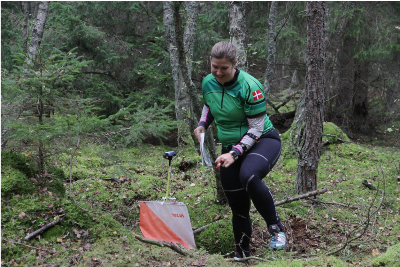
Tekst og foto Jørn Lind

Der findes i dag et meget stort udbud af idrætsgrene; både som holdsport og individuel sport, og der kommer løbende nye idrætsgrene til. Mange vil gerne prøve flere sportsgrene; og måske især de nye, som dukker op. Blandt de nye er bl.a. SUP (stand up paddle) og padeltennis. Det kan derfor være svært at fastholde idrætsudøvere inden for én bestemt sportsgren, og det kræver en ekstra indsats at tiltrække nye udøvere.