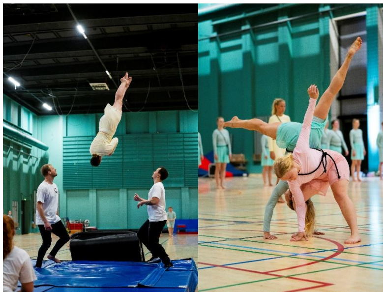
PI Opvisningsholdet til PI Gymnastiks lokalopvisning d. 4. maj 2024.

Ikke længe efter lokalopvisningen gik bestyrelsen i gang med at kigge frem mod sæson 24/25. Et kæmpe puslespil skal lægges med instruktører, faciliteter samt idéer og tanker for den kommende sæson. Nogle instruktører fortsætter, andre gør ikke og nye hold (gen)opstår. Bestyrelsen har en kæmpe opgave foran sig i forsommeren og sommeren over, så vi igen kan præsentere en varieret holdoversigt med tilbud til alle, uden at gå på kompromis med den kvalitet vi gerne vil levere i PI Gymnastik. For sæson 24/25 har puslespillet desværre ikke kunne gå op for enkelte hold, både pga. manglende instruktører samt opbakning fra deltagere. Det er selvfølgelig ærgerligt, når vi ikke kan tilbyde en lige så varieret holdoversigt med blandt andet PI Urban, PI Fokus, PI Mænd samt en springerside på Opvisningsholdet, men sådan er vilkårene desværre engang imellem i gymnastikkens verden. Vi er rigtig glade og taknemmelige for de instruktører vi har i sæson 24/25, og for den opbakning vores medlemmer har vist os til denne sæsons udbud af hold.