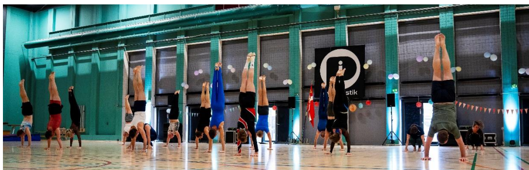
PI Old Stars til PI Gymnastiks lokalopvisning d. 4. maj 2024.

En tendens vi i bestyrelsen kan se i gymnastikken denne sæson er, at mange af vores træningshold har haft stor fremgang. Træningsholdene adskiller sig fra vores opvisningshold ved at have fokus på den ugentlige træning, hvor der kan svedes, nørdes og danses igennem, uden at der er et opvisningsprogram som slutprodukt. På Old Stars og Styrke er der tilgang af medlemmer, og PI Dans er blevet til et træningshold denne sæson. Derudover er Træningstyperne genopstået denne sæson, der med sine 65 udøvere og de andre træningshold i foreningen sammenlagt tæller over 100 medlemmer på træningsholdene. Det glæder mig, at vi i PI Gymnastik kan følge med tendenserne og udbyde hold, som vores medlemmer efterspørger.