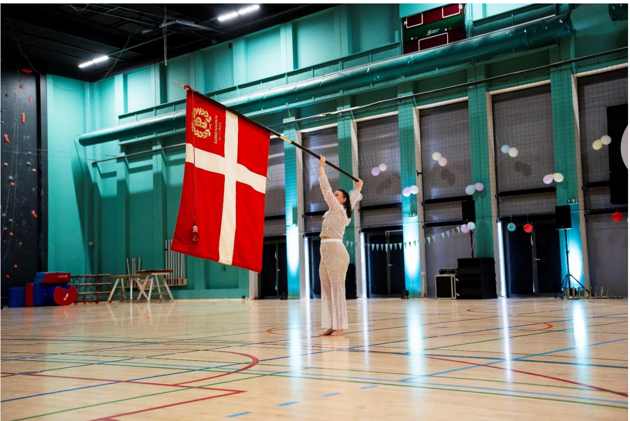
PI Gymnastiks lokalopvisning d. 4. maj 2024.