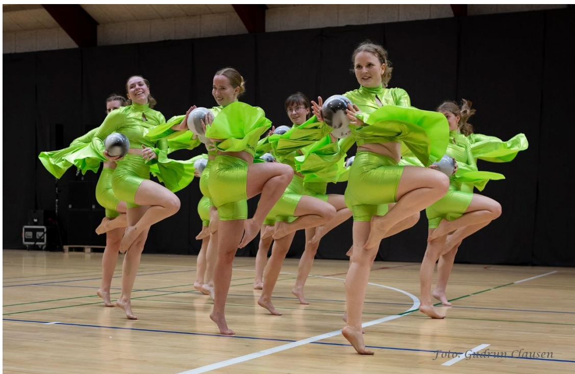
PI Øvede til Dejbjerglundstævne 2024.

Forårets kommen er for mange lig med mange timer ude i solskin og det lidt lunere vejr. Men for mange af PI Gymnastiks gymnaster er det ensbetydende med masser af timer inden for i de danske haller til opvisninger foråret igennem. Opvisninger der afholdes i hele Danmark, og hvor mange af PI Gymnastiks hold gerne tager til opvisninger på både Sjælland, Jylland og Fyn, og viser PI Gymnastik frem. En stor tak skal lyde til vores medlemmer ude på holdene, der er med til at vise PI Gymnastik frem til hele gymnastik-Danmark på bedste vis, så potentielle nye medlemmer ser vores vej, når de flytter til København.